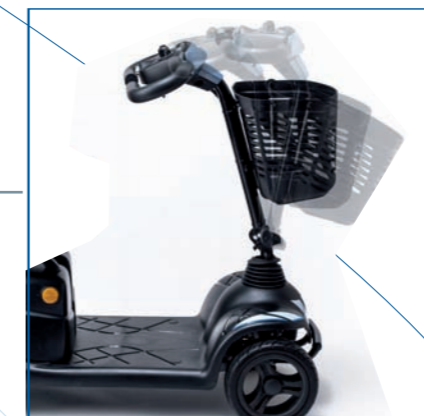
Columna de conducción