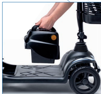
Baterías extraíbles para facilitar su recarga