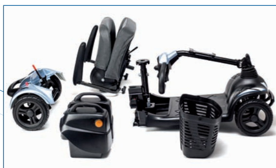
Desmontable en 4 piezas