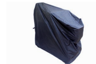
04060552: Funda de almacenaje