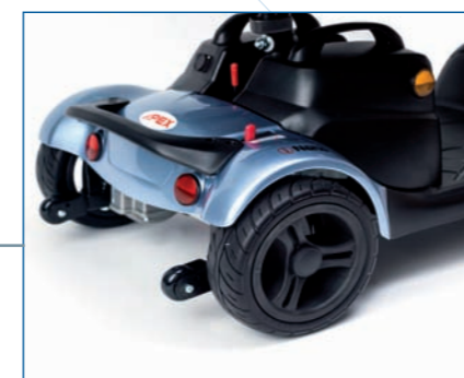
Palanca de desembrague y ruedas antivuelco